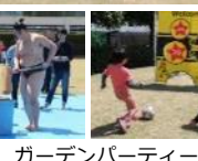
ガーデンパーティー