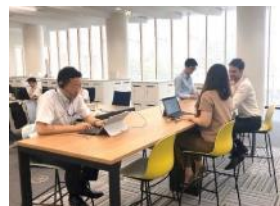
フリーアドレスにより コミュニケーションが活性化

「マブチの働き方改革」は、働き方の選択肢を増やして、社員一人ひとりが自分に合った働き方を実行することで、会社全体の生産性を高めることを目指しています。会議の効率化、報告手段の標準化、資料の電子化などこれまで社内への浸透を図ってきたもののほかに、2019年からテレワーク・サテライトオフィスの本格導入や、社内レイアウトの変更（一部フリーアドレス制を実施）、ITツールの充実など益々進んでおります。