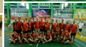
バドミントン大会（東莞マブチ）