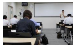
タバコ・アルコール講座