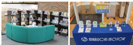
読書コーナーとおすすめ書籍の紹介