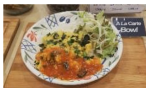
社員食堂の野菜たっぷりヘルシープレート